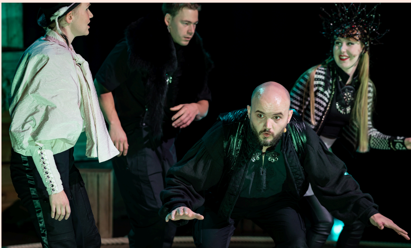
Bilde fra Kvääniteatteris første forestilling Näkymätön kansa - Det usynlige folket fra 2022.

Vi gleder oss til å møte deg og gi deg en hyggelig opplevelse!